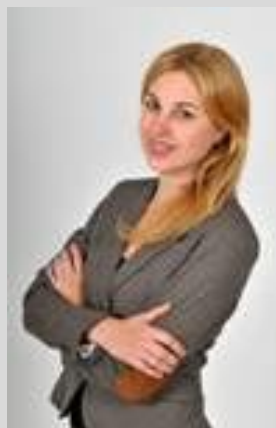
Agnesi Irbi SIA “Annahouse” īpašnieci