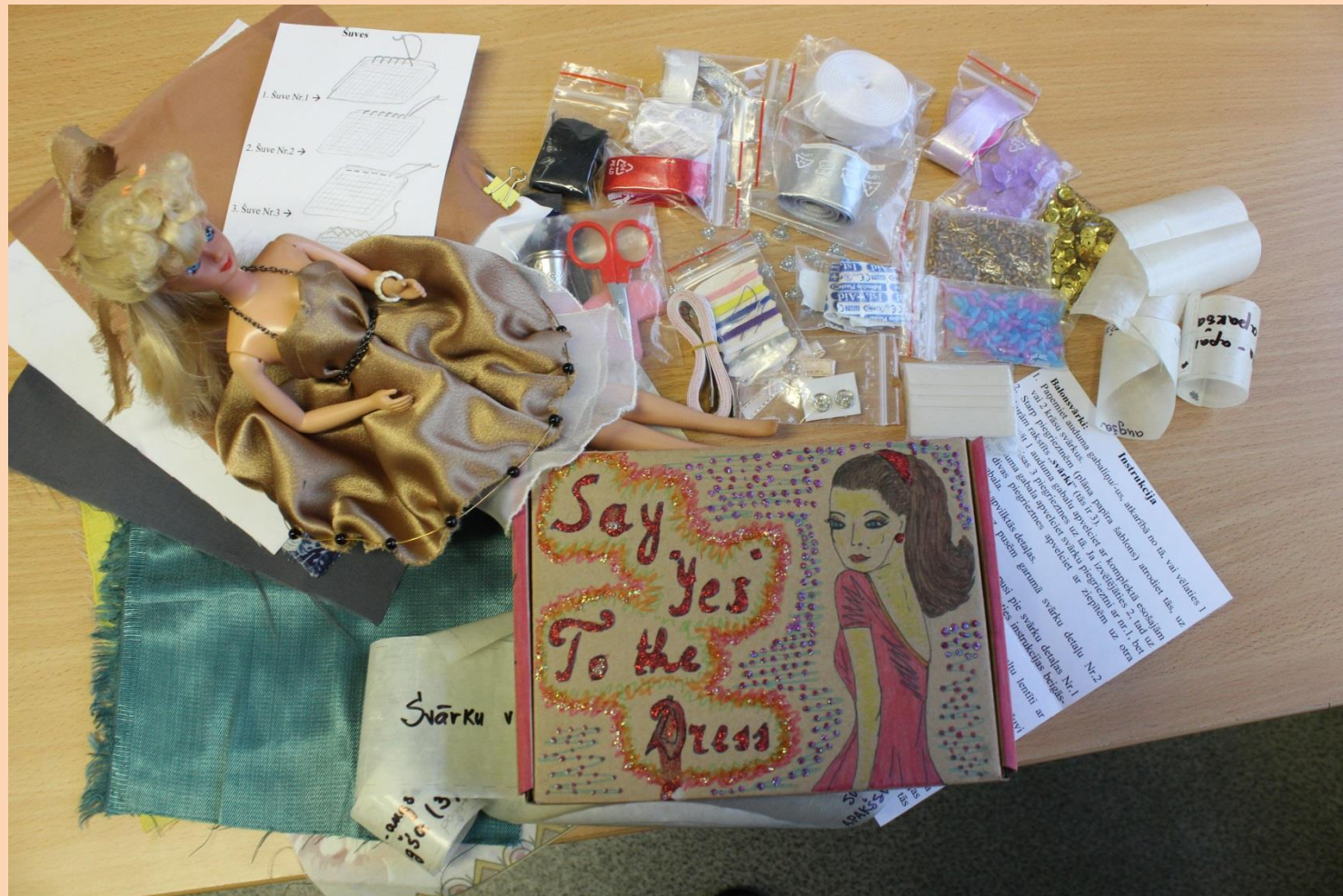
Barbie lelles drēbju šūšanas komplekts