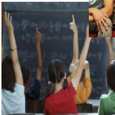
Mācību darbības uzlabošanās un interese par to